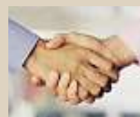
10 Jahre Garantie