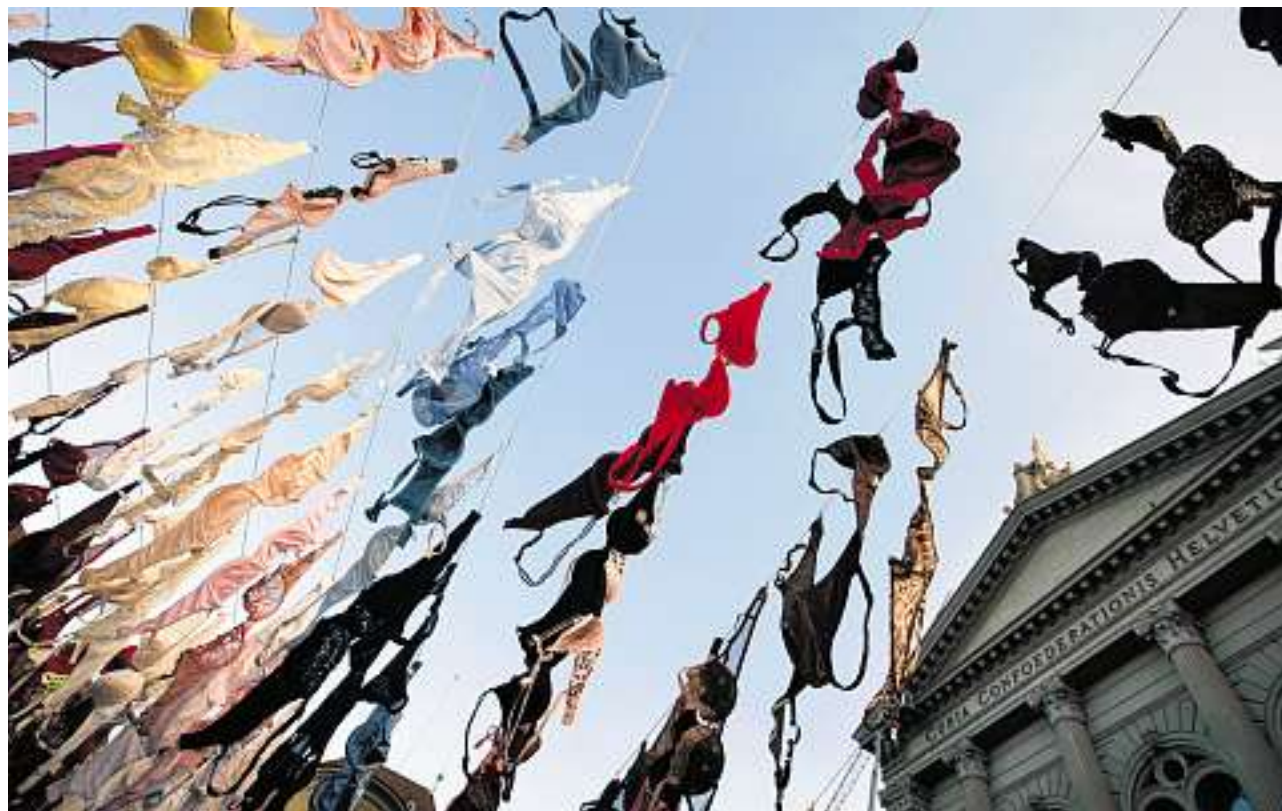
Reizvoll, aber sehr ernst gemeint: Hunderte Büstenhalter hängen auf dem Bundesplatz in Bern.

Bern. – Mit einer spektakulären Aktion ist gestern vor dem Bundeshaus in Bern für die gesamtschweizerische Einführung von Brustkrebs-Früherkennungs-Programmen demonstriert