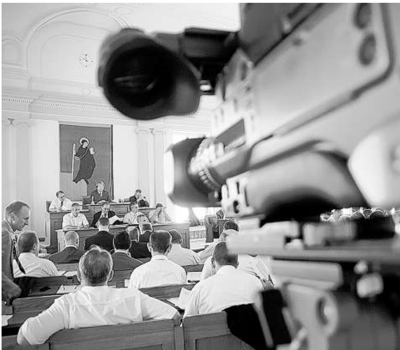
Grosses mediales Interesse am Fall Anna Göldi: Ihre Rehabilitation wird im Landrat nicht mehr debattiert.