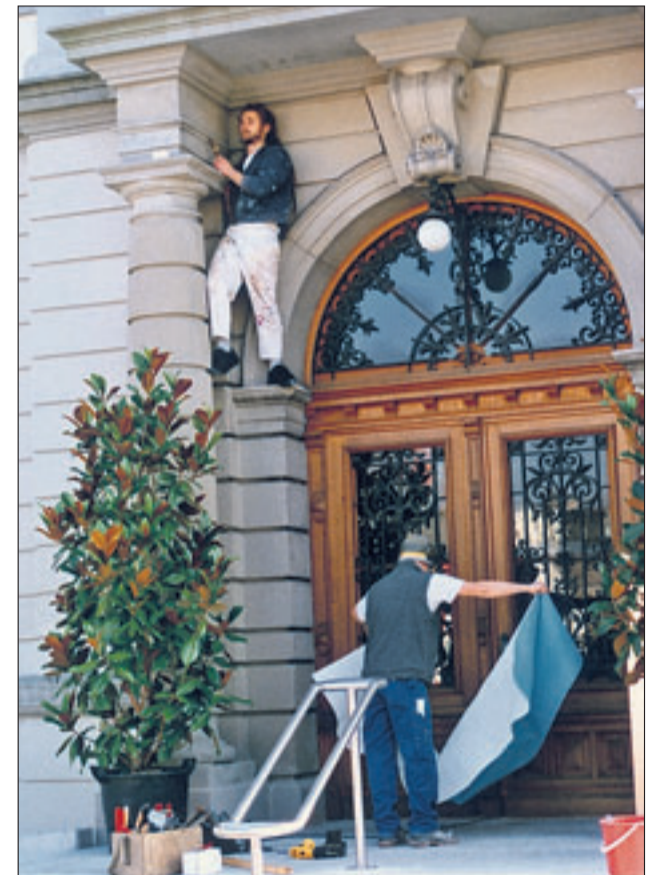
«Mugg» und Co. werkeln noch am Eingang herum.

Nach beschwingtem, kunstvollem und virtuosem Interpretieren befasste sich Archivar Alfred Tanner mit Erreichtem im Archiv, mit gefundenen und sorgsam restaurierten für kurze Zeit im Saal ausgestellten Raritäten. Von der Schönheit des Gebäudes war er ebenfalls angetan, ebenfalls von den Schriften im Archiv und vom hohen Können seiner Lehrtöchter. Musik und Apéro bildeten den Abschluss eines gehaltvollen, festlichen Nachmittags. ● me