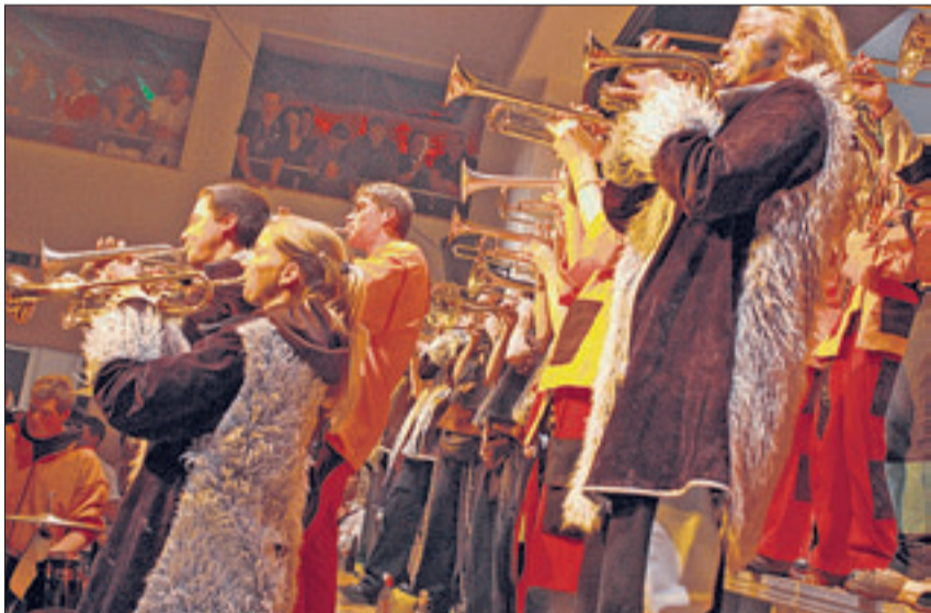
Die Guggen stimmten im «GH» lautstark auf die Fasnacht an.

Traditionsgemäss wurde am Sonntag, dem 11. 11., die Fasnacht mit einem Guggen-Konzert auf dem Rathausplatz eingeläutet. An Abend verkündeten die Fasnachtsgesellschaften im «GH», Ennenda, die Mottos für das kommende Jahr. Den Glarnern steht eine abwechslungsreiche «Fünfte Jahreszeit» bevor.